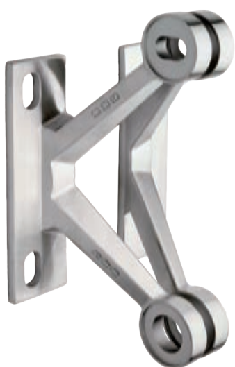
Спайдер двулапный (левый, правый)